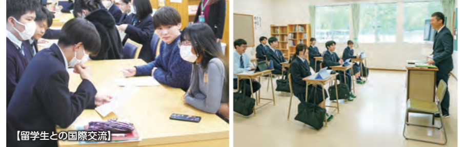
【留学生との国際交流】