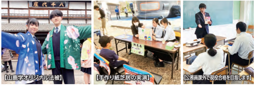
【山鹿学オリジナル法被】

普通コースは“希望”コース。 進学・就職、多様な進路に対応します。 「キャリア教育」「IT資格取得」「公務員現役合格」「山鹿学」 4つの柱で知性と感性を育みます。