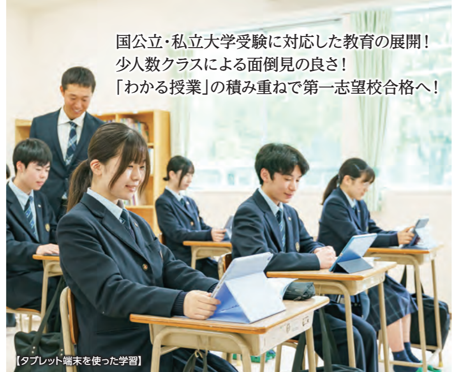
【タブレット端末を使った学習】