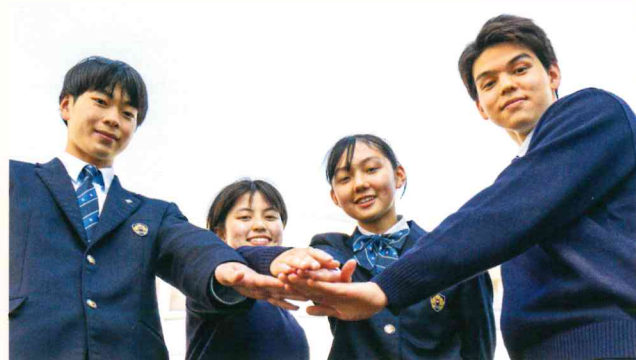
一人ひとりを認め合う