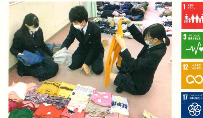
「届けよう、服のチカラ」プロジェクトの活動

城北高校ではSDGs17の目標への様々な活動を行っています。一昨年度より「届けよう、服のチカラ」プロジェクトの活動に賛同し、城北プロジェクトもスタートさせ、2500枚の子供服を難民の方々へ送らせていただきました。今後も生徒たち自身ができる社会貢献活動として山鹿地域にも広げていく予定です。また、年間100kgものペットボトルキャップ収集を行い推進事業者を通してワクチンに換える活動や城北オリジナルエコバックを使用し、プラスチックゴミ削減に努めています。持続可能な社会の担い手としての視点と行動力を身に付けるべく、各科独自の取り組みも積極的に行っています。