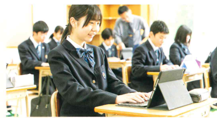
Society5.0で活躍できる人材育成