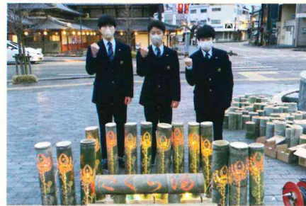
山鹿市豊前街道竹明かり参加

城北高校では全校生徒が「希望手帳」という手帳を持っています。1日のスケジュールを記録し、1日の自分の活動をわかりやすくしています。また、3年間の学びの記録となるキャリアパスポートの役割もあります。