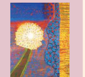
美術部 熊本県高校美術展入賞 熊本県水画会展入賞 九州高校生絵画コンクール準グランプリ 日本高校生デザイングランプリ入賞など