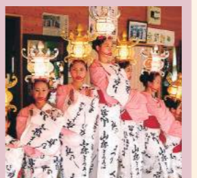
ダンス部 海外公演など 各種イベントに参加