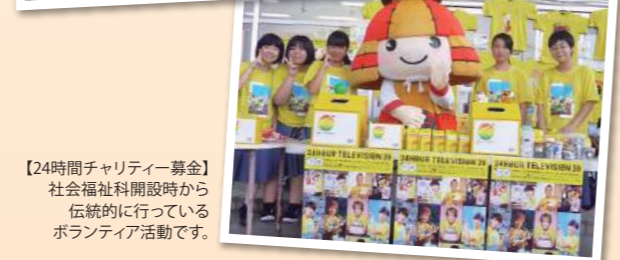
【24時間チャリティー募金】社会福祉科開設時から伝統的に行っているボランティア活動です。