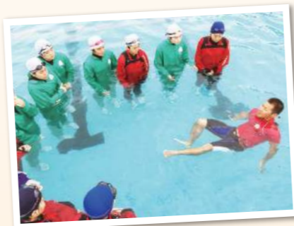
【着衣泳の講習会】 一般社団法人水難学会の講師による水難事故防止、人命救助の方法を学んでいます。