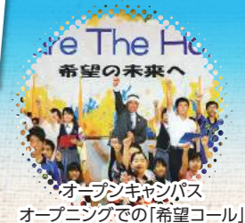
オープンキャンパス オープニングでの「希望コール」