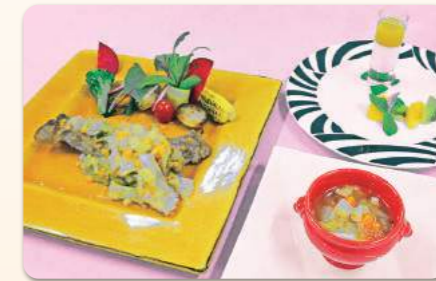
フレンチ特別講義献立