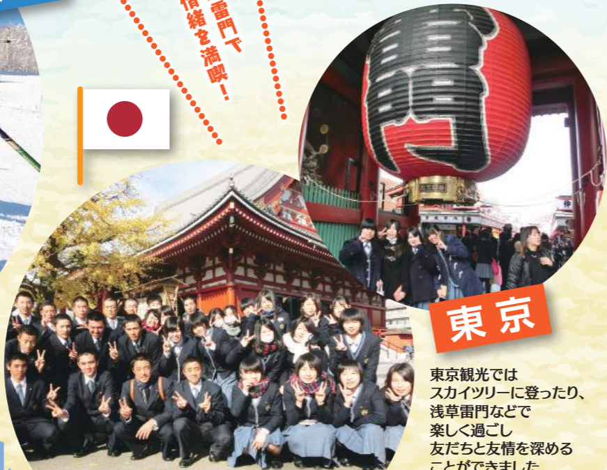
東京観光では スカイツリーに登ったり、 浅草雷門などで 楽しく過ごし 友だちと友情を深める ことができました。