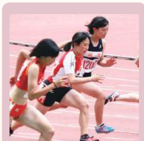
陸上部 全国大会出場22回 九州大会出場84回 三段跳九州大会出場