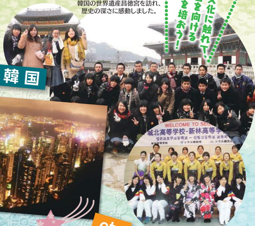
韓国の世界遺産昌徳宮を訪れ、 歴史の深さに感動しました。