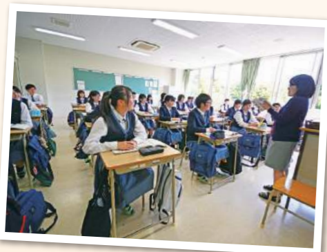
【授業風景】授業では専門的な知識はもちろん、看護師の資格を目指して学習します。