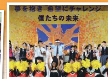
オープンキャンパス