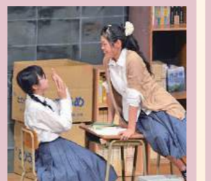
演劇部 全国大会初出場!!「かけの歌」 九州大会出場9回(優秀賞3回・創作脚本賞1回・舞台美術賞1回)、熊本県大会23回出場(最優秀賞12回・舞台美術賞5回・創作脚本賞1回)