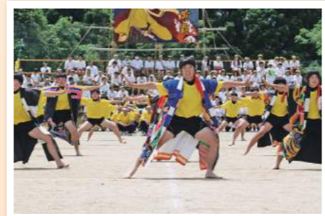
【パフォーマンス発表】 体育大会における華やかかつ力強い女子のソーラン節