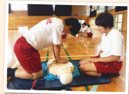
【日本赤十字救急法講習】 日本赤十字社救急法救急員の資格取得のための講習です。