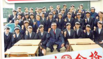
【はちまき授与式】絶対合格