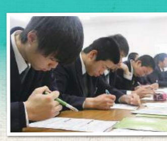
進路ガイダンス(2月・3月)