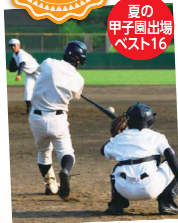
夏の甲子園出場ベスト16