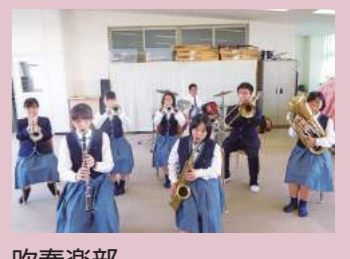
吹奏楽部 校内行事はもちろん、コンクールへの出場や介護施設での慰問演奏など、校外でも幅広く活動しています。合い言葉は「We make you happy!」(あなたをハッピーにするよ!) 楽しく、聞いた人の心が温かくなるような演奏を目指しています。