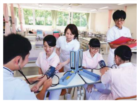
【基礎看護II演習】バイタルサイン測定