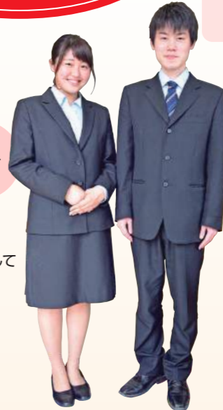
看護専攻科独自の制服も人気です!