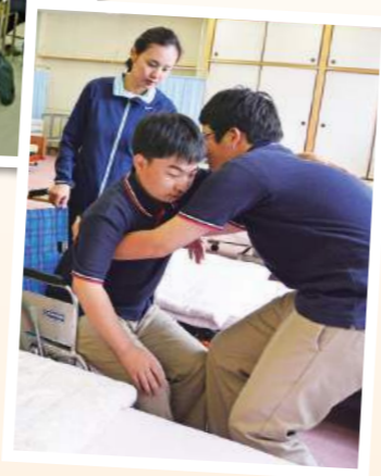
【生活支援技術】介護に必要な専門的な技術を身につける校内実習を行います。