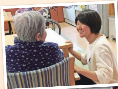
【介護実習】施設において、介護実践を積み重ね、知識・技術・人間性を磨きます。