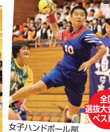
全国選抜大会出場ベスト16

女子バレーボール部 九州大会出場2回、平成25年度熊本県バレーボール協会長杯3位、平成26年度県大会3位、平成26年度県会長杯3位、平成26年高校総体3位、平成27・28年九州ビーチバレージュニア選手権2連覇中