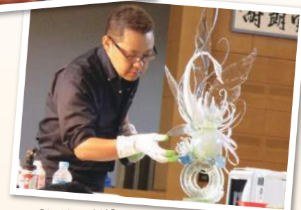
【あめ細工実演】 著名な講師のパフォーマンスに感動。