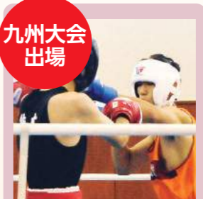
ボクシング部 全国大会出場12回 九州大会出場26回