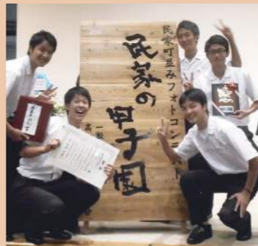
民家の甲子園 3年連続全国大会出場!!